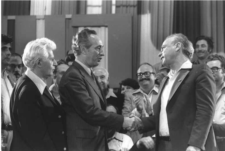
פרס ורביץ בוועידת המפלגה, 23 בפברואר 1977.

אישית ולא אידאית, מכיוון שאצה לו הדרך לראשות השלטון". 82 ב-5 בפברואר 1977 הודיעו שני המועמדים לראשות הממשלה, רביץ ופרס, כי הסכימו על כך שההתמודדות על תפקיד זה תהיה בוועידת מפלגת העבודה הקרובה וכי הצבעה חשאית של הצירים תתקיים ב-23 בפברואר, ביום השני לוועידה. בשני המחנות התכוננו להכרעה, וככל שקרב מועד הוועידה ומועד ההתמודדות בין רביץ לפרס, גברה הפעילות בשני המחנות, בעיקר בהודעות שני המטות על הזדהויות ותמיכות של אישים וגופים. רביץ ופרס היו בטוחים בניצחונם ובניצחון המפלגה בבחירות, השתתפו בכינוסים רבים ופגשו פעילים. יצחק רביץ ושמעון פרס היו שונים מאוד באופיים. רביץ היה מופנם וביישן, פרס היה מוחצן וחברותי. רביץ נמנע משיחות טלפון עם הצירים בוועידה, פרס לעומתו הרבה בשיחות וכך הצליח לסחוף פעילים רבים לטובתו. עם מותו של ספיר באוגוסט 1975 איבד רביץ את תמיכת אחת הדמויות המרכזיות והמשפיעות ביותר במפלגה, אולם נשען עדיין על תמיכתה של גולדה וזכה לתמיכת התנועה הקיבוצית. אולם צירים רבים עדיין התלבטו בין השניים. פרס זכה לתמיכת מחנה נלהב של צעירים שסגנונו החדשני דיבר אליהם, רביץ זכה לתמיכה בלתי מסויגת מצד ותיקי מפלגת העבודה.