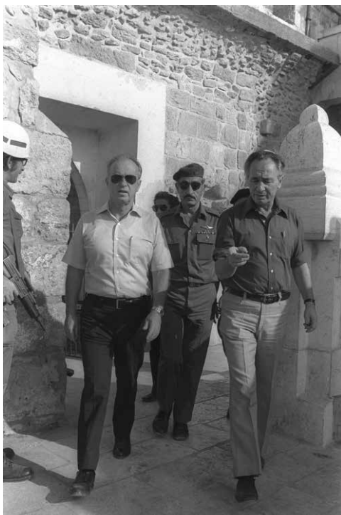
שמעון פרס ויצחק רבין בביקור במערת המכפלה, אוקטובר 1976.

מעימותים מיותרים. "העימות בין יצחק רבין לבין שמעון פרס הוא כמעט בלתי נמנע", כתב העיתונאי דניאל בלוך בדבר ב-15 באוקטובר 1976, והוסיף כי העימות בין השניים נובע, בראש ובראשונה, "ממשבר הנהגה במפלגת העבודה לאחר מלחמת יום הכיפורים". עוד קבע בלוך כי יצחק רבין "עדיין לא ביסס מעמד בלתי מעורער במפלגת העבודה" וכי מאז מלחמת יום הכיפורים "פסה כאריזמה מן הנהגה". 74 בידיעות אחרונות כתב העיתונאי ישעיהו בן פורת כי "ראש הממשלה חושד בשר הבטחון שמן היום הראשון הוא לא השלים עם מעמדו הבכיר. ומאז הוא חותר תחתיו בעקביות במגמה להשמיט מידי את ראשות הממשלה". הוא תיאר כיצד ישבו רבין ופרס זה לצד זה בעצרת לרגל יום הולדתו התשעים של דוד בן-גוריון וקבע: "חבל שלא נמצא שם מישהו בעל סמכות מוסרית, שיאמר להם לשניהם שחובה עליהם לעשות כל המאמץ הנפשי והאינטלקטואלי הדרוש כדי להתעלות מעל לחשבונות קטנים ואוויליים". 75 מצבה של המפלגה היה ברור לכול, ובכינוסים שונים לקראת סוף שנת 1976 ביקשו חברי המפלגה ופעילים מרכזיים לדון בדרכה. תחושת ההתפוררות שפקדה את המפלגה חייבה לקבוע מנהיגות מובילה, אולם עדיין לא היה ידוע מועד הבחירות הפנימיות.