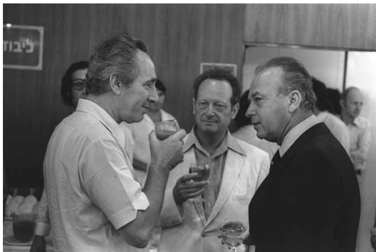
רבין, פרס ויגאל אלון, ספטמבר 1974.

מקור שני למתיחות היה הפער הקטן בתוצאות ההצבעה בין השניים בהתמודדות על ראשות הממשלה. החשש מפני התמודדות מחדשת היה נעלם לו הצליח רבין ליצור לעצמו מעמד בלתי מעורער כראש המפלגה, אולם הדבר לא עלה בידו. מקור נוסף למתיחות נבע מחילוקי דעות בין רבין לפרס בשאלת השטחים שכבש צה"ל במלחמת ששת הימים. רבין תמך בעקרון הפשרה הטריטוריאלית עם ירדן על פי עקרונות "תוכנית אלון" 6 ; פרס, שהיה ניצי ממנו, תמך בגישת "הפשרה הפונקציונלית" 7 , שדגלה בהתנחלות יהודית בגב ההר. 8 רבין אף טען כי פרס פעל בניגוד למדיניות הממשלה שבה כיהן, בעודו התנחלות בכל מקום. 9