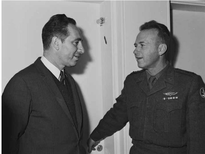
רבין ופרס, ינואר 1963.

לא אחת בעמדות מנוגדות כאשר כל אחד מהם מנסה לרתום את הרמטכ"ל או את מפקד חיל האוויר. שמעון פרס ביקש לעודד את היחסים עם צרפת, שם רקם קשרים עם הצמרת הביטחונית, ואילו רבין גרס שיש לפתח אוריינטציה אמריקנית. בינואר 1963 כמעט הצליח שמעון פרס לטרפד את מינויו של רבין לרמטכ"ל כשטען באוזני ראש הממשלה בן-גוריון כי רבין "הססן" וכי במינויו לתפקיד הצבאי הרם "מוסרים הצבא לידי ארגון מפלגתי" 3 . בן-גוריון, כך על פי הביוגרף שלו מיכאל בר-זווה, חיבב את רבין עוד מימי מלחמת העצמאות והיו שטענו כי יחסו הושפע מחברותו עם הוריו, נחמיה ורוזה רבין. 4 פרישתו של בן-גוריון ביוני 1963 וכהונתו של לוי אשכול כראש הממשלה חיזקו את מעמדו הצבאי והפוליטי של רבין והוא מצא שפה משותפת עם אשכול בכל עניין שבו היה חלוק עם פרס. בפיצול מפא"י בשנת 1965, כאשר בן-גוריון ותומכיו בני הדור הצעיר של המפלגה, ובהם פרס ומשה דיין, הקימו את רפ"י, מצא עצמו רבין מזוהה פוליטית עם אשכול. מצב זה העמיק את התהום הפעורה בין רבין ופרס. צבי דינשטיין, שהחליף את פרס בתפקיד סגן שר הביטחון משנת 1966, ואשכול, היו חסרי ניסיון בתחום הביטחון ונשענו על רבין שהפך למעשה לשר הביטחון בפועל.