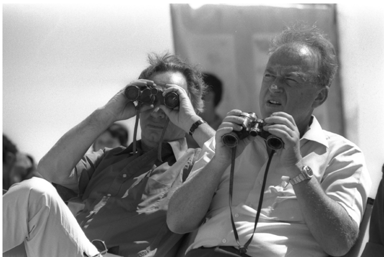
פרס ורבין בתרגיל של חיל השריון בסיני, יולי 1976.

זה של מפלגת העבודה, וחבר הכנסת משה נסים העלה ב-13 במאי 1976 הצעה לדיון בסדר יומה של הכנסת בעניין תפקודה של הממשלה נוכח היחסים בין ראש הממשלה לשר הביטחון. ההצעה נדחתה.